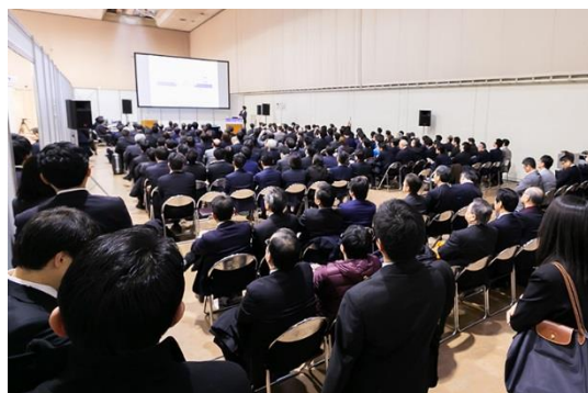
2019年1月開催「北海道IRショーケース」 基調講演の様子